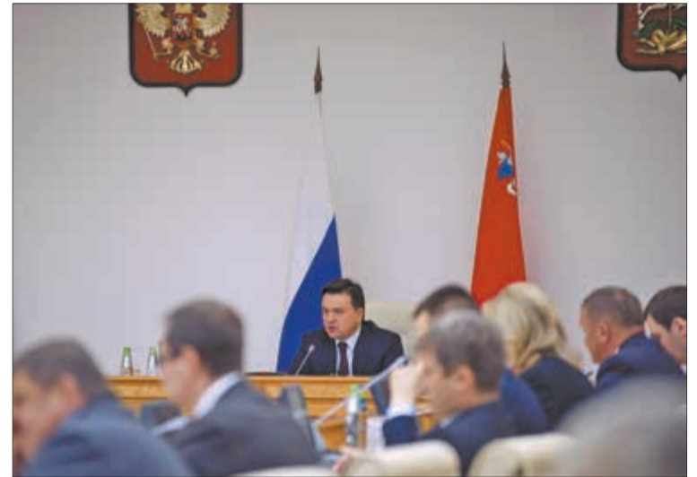
Андрей Воробьев подчеркнул, что в Подмосковье останутся только УК, которые работают честно и открыто

— Если УК работает в закрытом формате от жителей, они просто не знают, что делать, и жалуются губернатору