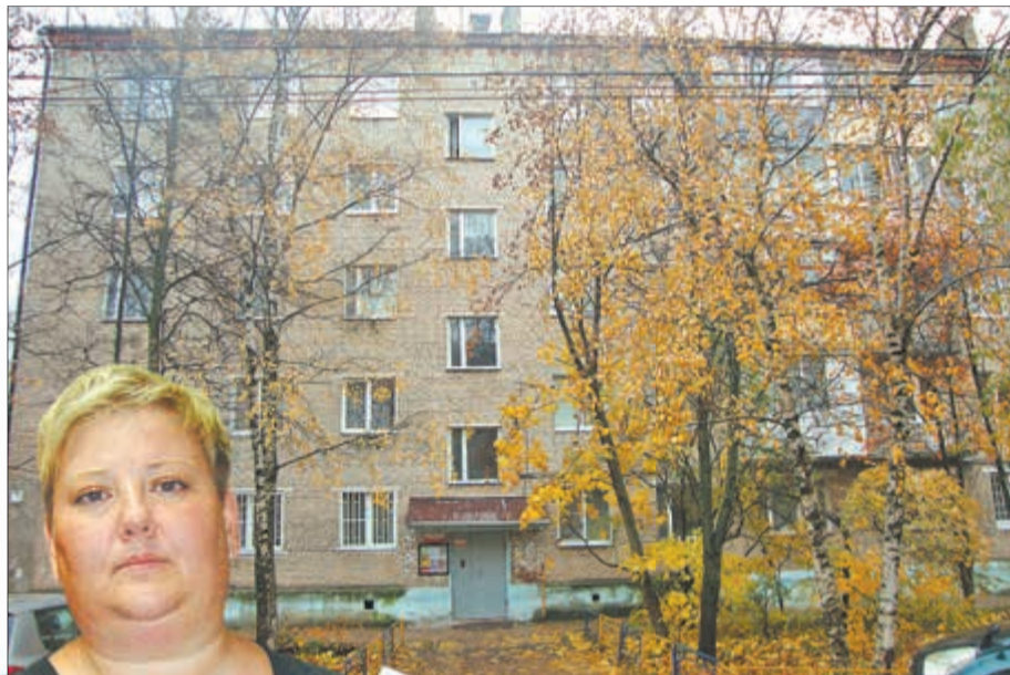
За 40 лет дом обслуживался разными управляющими компаниями, но райской жизни не видел ни при одной.

— Судя по всему, мы у МУП СПМР на временном обслуживании, пока нам не подберут другую УК, — рассуж-