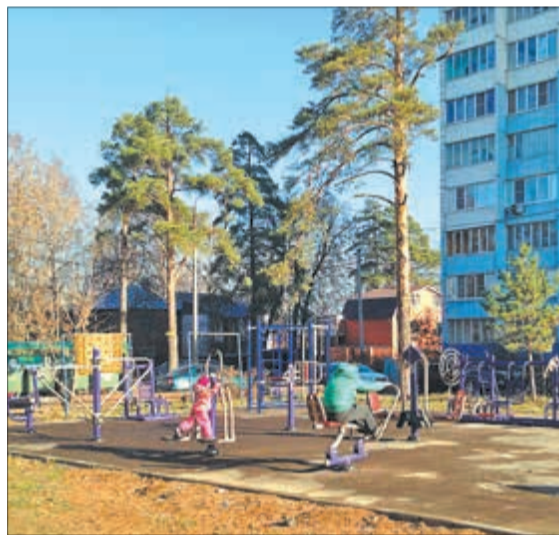
Новые тренажеры сразу же привлекли внимание местных жителей, особенно ребятишек

Работа по их установке началась параллельно с обновлением и заменой устаревших детских площадок. В Тарасовке, Лесных Полянах и Челюскинском таких игровых зон около 30. И они функциональны потому, что администрация поселения прилагает немало усилий для поддержания их в исправном и эстетически приглядном состоянии. Сами жители тоже не остаются в стороне. С 2013 г. началась замена наиболее устаревших площадок на современные спортивно-игровые комплексы. Первый появился в поселке Лесные Поляны на ул. Ленина, затем в селе Тарасовка на ул. Центральная, и теперь – в Челюскинском.